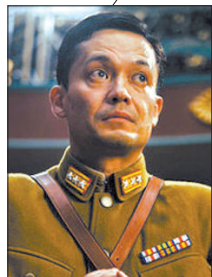
日本军官鸟山(山崎敬一饰)