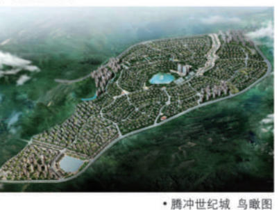
•腾冲世纪城 鸟瞰图

作为世纪金源集团在滇的又一巅峰巨作，传承世纪金源集团无限的尊贵品质，腾冲世纪城将以生态健康为导向，在素有中国的“温哥华”之称的宝地腾冲，成就腾冲旅游综合地产开发项目又一震撼之笔。