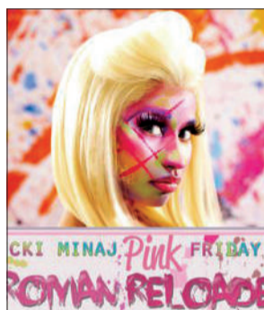
Nicki Minaj《Pink Friday》

北欧风味十足的著名日本后摇乐团“世界末日女朋友”为电影《星空》的原声配乐给电影加分。但如果抛开电影,该专辑与之前的专辑相比,缺乏想象力,也许是“命题作文”而略显畏手畏脚。