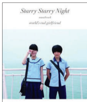
World's End Girlfriend《Starry Starry Night》

不用身临现场,只是听现场专辑,已可以感受到莫文蔚这个情感丰富的歌手在台北小巨蛋舞台上的投入。虽然唱功不算一等等,但《忽然之间》《他不爱我》等情歌足以让人感知到她的真性情,也给这些原本有些轻巧的音符赋予了新的想象。