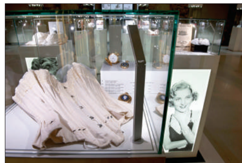
天梭“见证时代”女士钟表展。