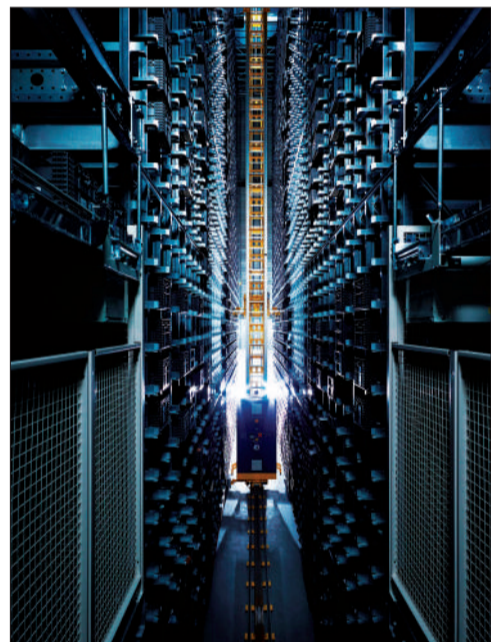
充满科技感和未来感的物流机器人。

如今,钟表的制作不再仅仅是手工活儿了,新科技和新技术的引进,让钟表的生产 and 质检都变得更加快捷。高科技的仪器被运用到检测中,被抽检的腕表将接受通过模拟振动10000次来检测表带质量,模拟按动10000次按钮后来检查按钮功能及防水性能等试验来进行质量检测。