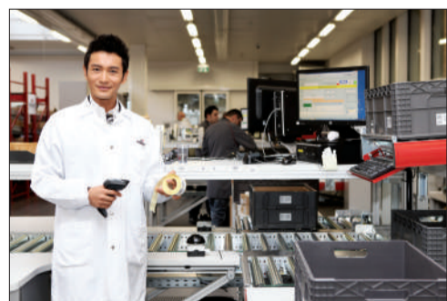
中国影星黄晓明充当了一次物流技工。