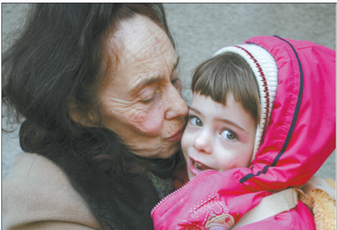
2008年,罗马尼亚,一名70岁老妇与靠捐献精子产下的2岁女儿。