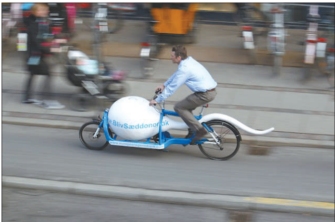
欧洲最大的精子库之一 Nordisk 精子库的“运精车”。

与那些匿名捐精者不同,霍本认为,每个孩子都有权知道谁是自己的亲生父亲,而不是一直等到成年的时候通过法律途径找到。在霍本房间的电子相框里,他的82个孩子的照片在不停地闪过,他可以念出每个孩子的名字。