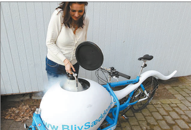
“运精车”内装有冷却箱。