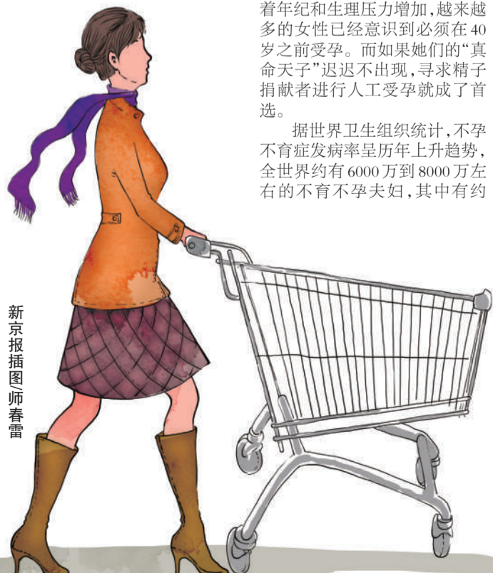
新京报插图师春雷