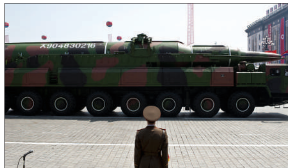
15日,朝鲜阅兵式上展示的导弹。

此前,美国导弹问题专家赖特在一次研讨会上甚至称,朝鲜在阅兵仪式上公开的新型导弹看起来像是用多层纸糊起来的,不是实际导弹的模型,不足以视为新的威胁。 (宗和)