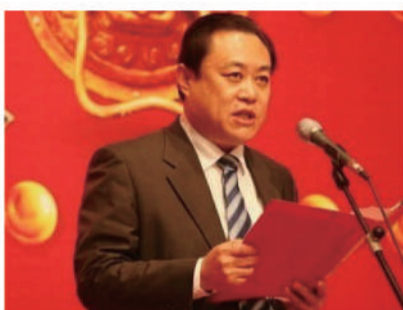
临沂市旅游局长 支富增