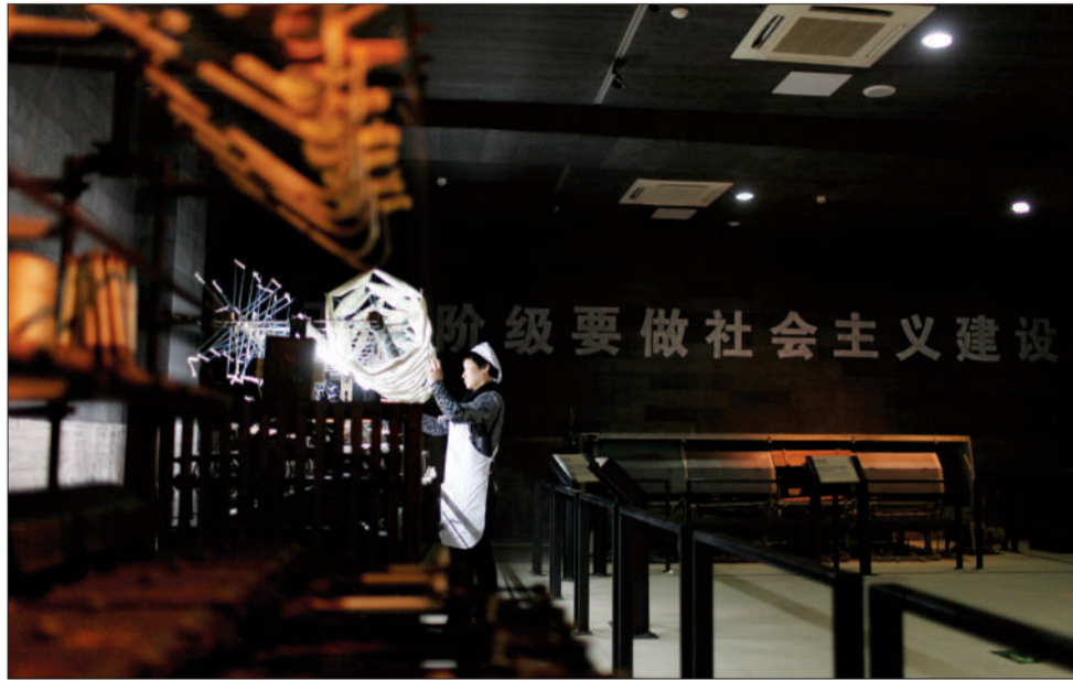
无锡南长街，依托永泰丝厂旧址改建而成的中国丝业博物馆。这里也曾是大运河所成就的无锡近代工商业的重要组成部分。