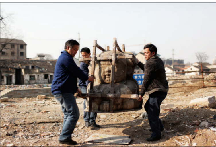
拆迁改建中的工地上，惠山泥人厂的工作人员正在搬运一个大型“阿福”模具。