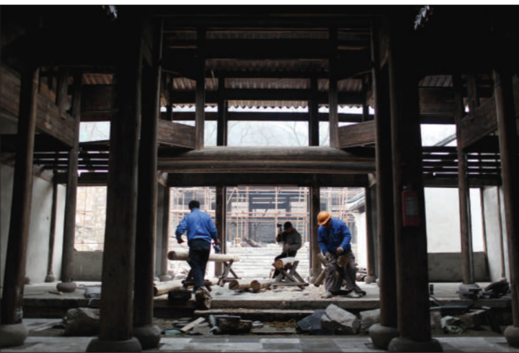
惠山古镇一处正在整修的祠堂。惠山已发现118处祠堂建筑和遗迹，汇集了自唐代至民国时期的80个姓氏，180位历史名人。