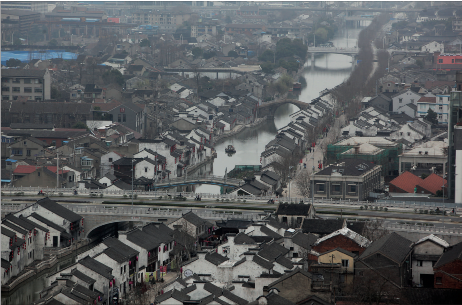
依傍古运河河道，无锡清名桥一带正在打造历史文化街区。其实，这里曾经处于无锡城外，而古运河贯穿无锡旧城区的主河道早已填平，变身为繁华的城市主干道——中山路。