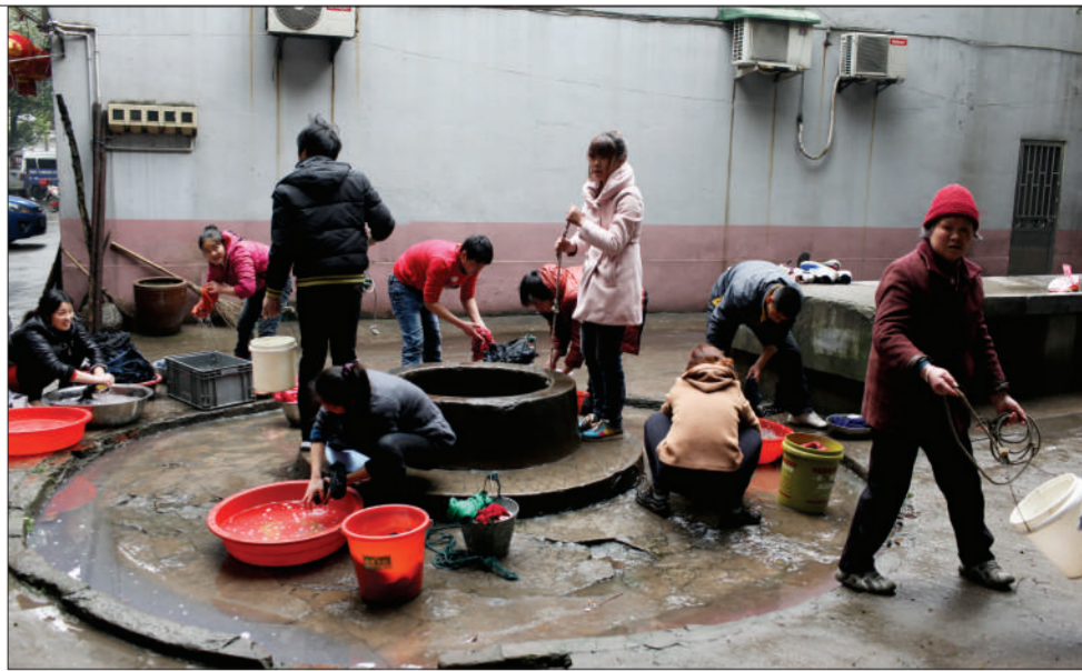
无锡新光村上浦巷，一群居民取用井水洗衣洗菜。