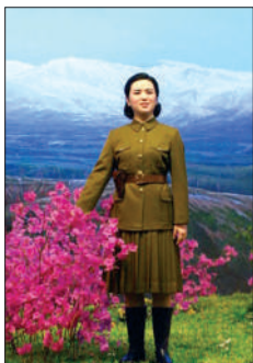
金正日母亲金正淑蜡像。

金正淑是金正日之母,她于1935年9月在中国东北地区参加了由金日成领导的朝鲜人民革命军,1937年加入共产党,后与金日成结为伉俪。在抗日战争时期,她曾多次参加与敌人的激战,从事过地下工作,被捕入狱后坚贞不屈。解放后回到朝鲜,投身于祖国的恢复建设和统一事业,于1949年9月22日去世。(综新)