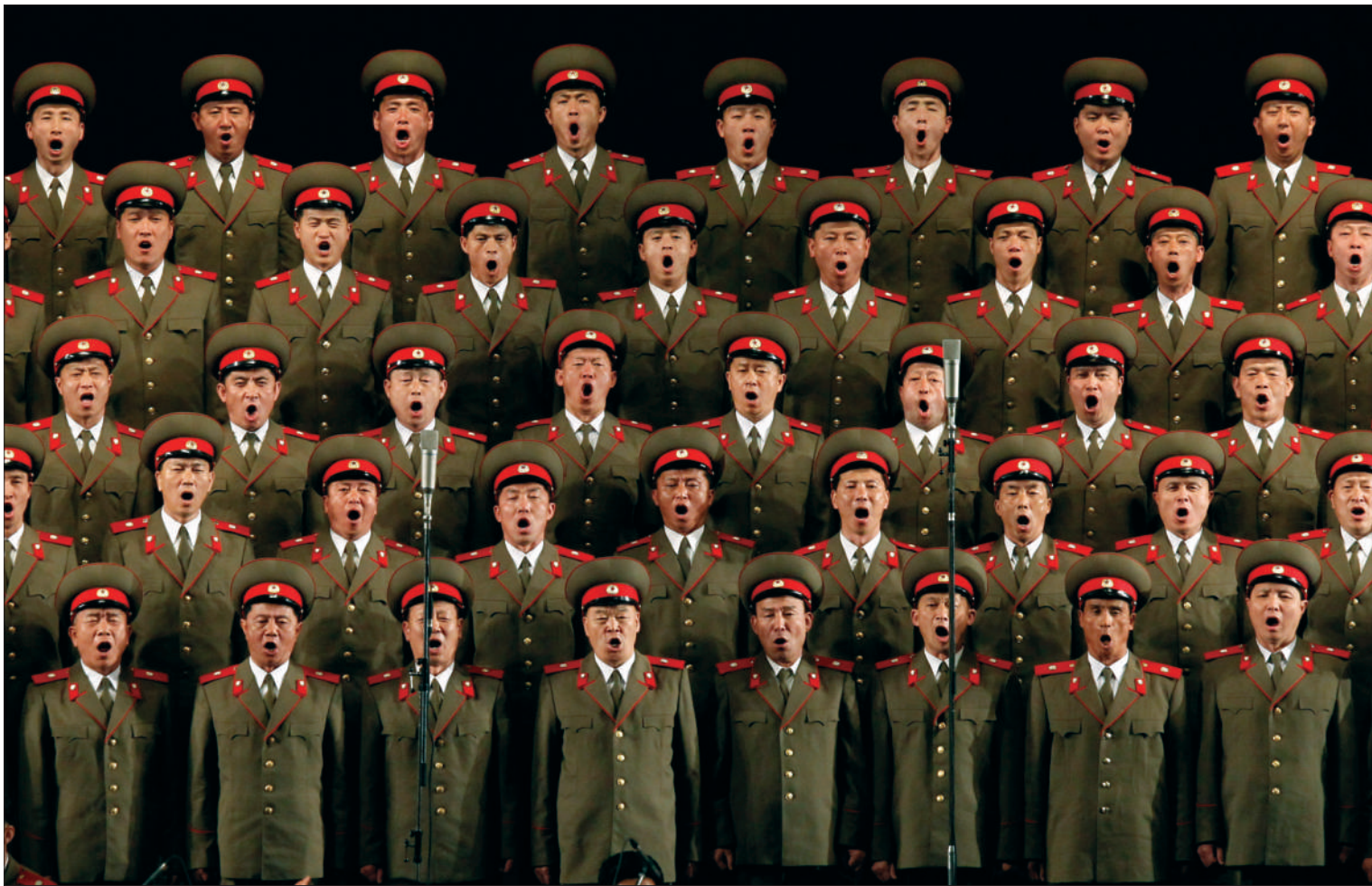
25日,平壤四二五文化会馆,朝鲜军人正在高歌庆祝建军80周年,当天朝鲜党政军主要领导人参与报告会。