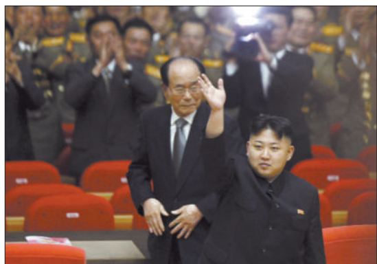
25日,金正恩(前)和委员长金永南(后)出席报告会。