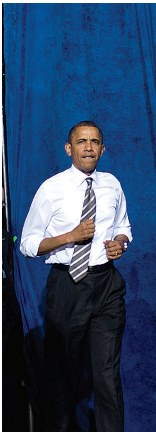
4月24日,奥巴马来到北卡罗来纳大学教会山分校,准备发表演讲。