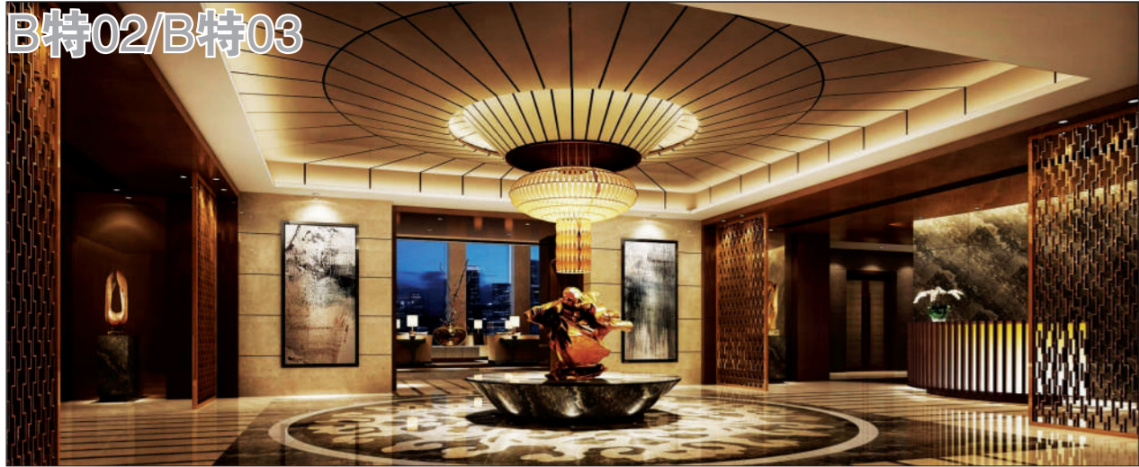
西山壹号院各单元设有地上、地下双入户大堂。图为会所大堂。