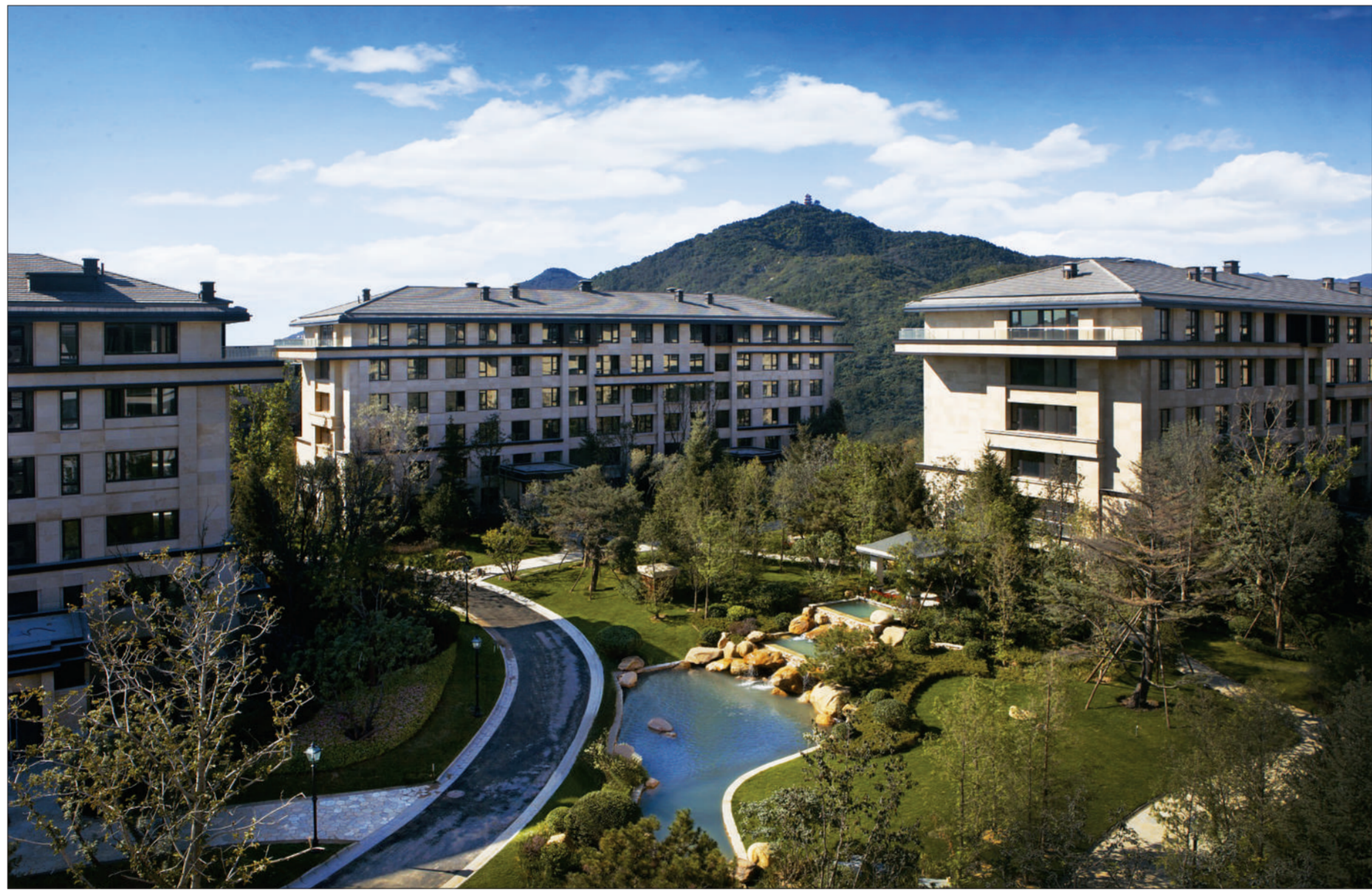
西山壹号院园区内建筑犹如珍珠般散落于园林之中,4-6层低密度大宅掩映在园林之中,不破坏西山板块原有的天际线,景观与西山一脉相承。

西山,在北京的自然地理和人文地理语境中,一直是一个美丽、典雅、尊贵的地方。900年来西山板块贵为京都皇脉所在,历代皇家贵族皆居住于此。而今,亦是国家部委机关、部队、高校大院所在之处。