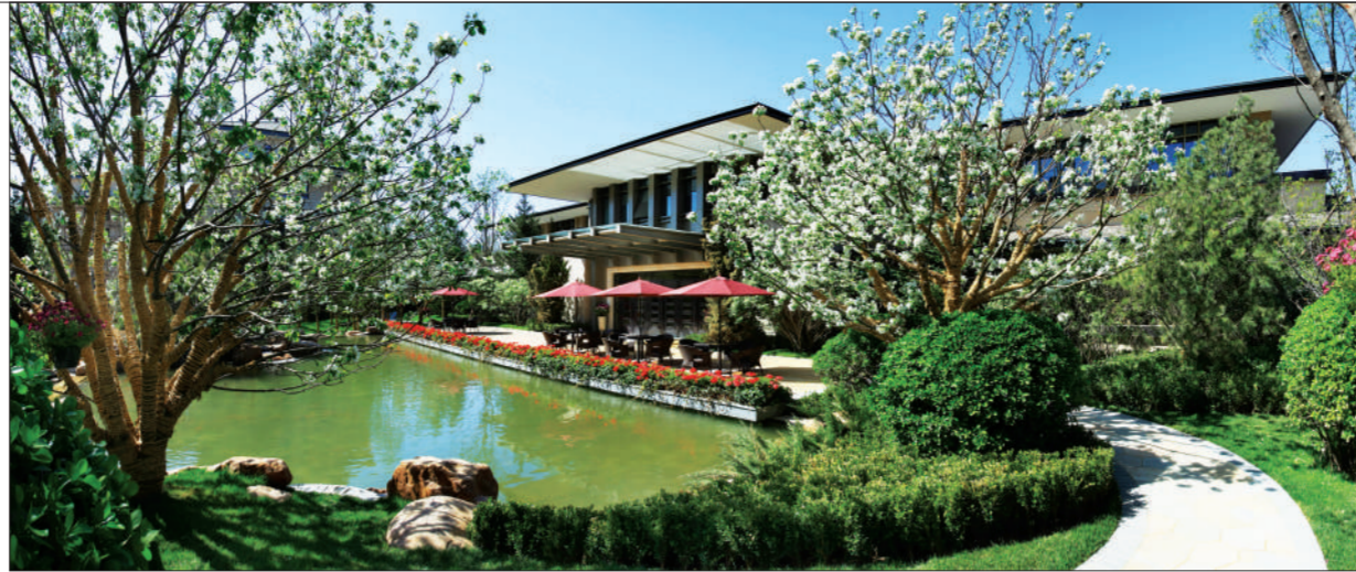
西山壹号院将回水管、通讯线路等13路管线设置在地下车库顶板下,整体井盖数量减少约85%,使园区景观更为完整。