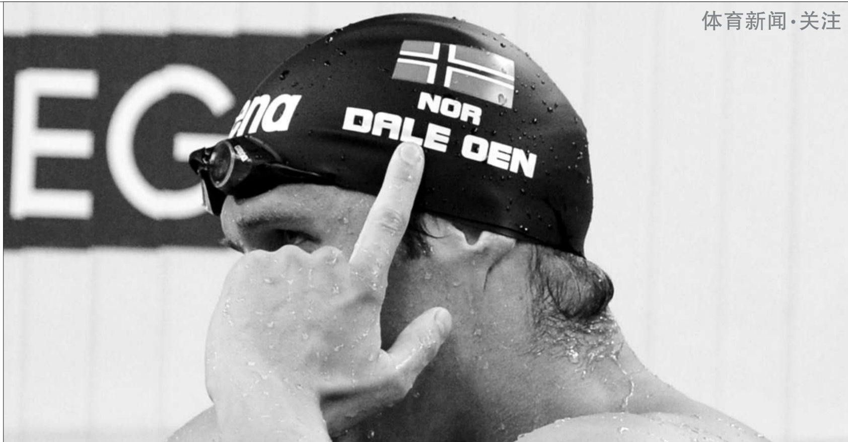
2011年上海游泳世锦赛,奥恩在获得男子100米蛙泳冠军后,用手指着泳帽上的挪威国旗,来悼念刚刚在挪威被贝雷维克屠杀的77个亡灵。