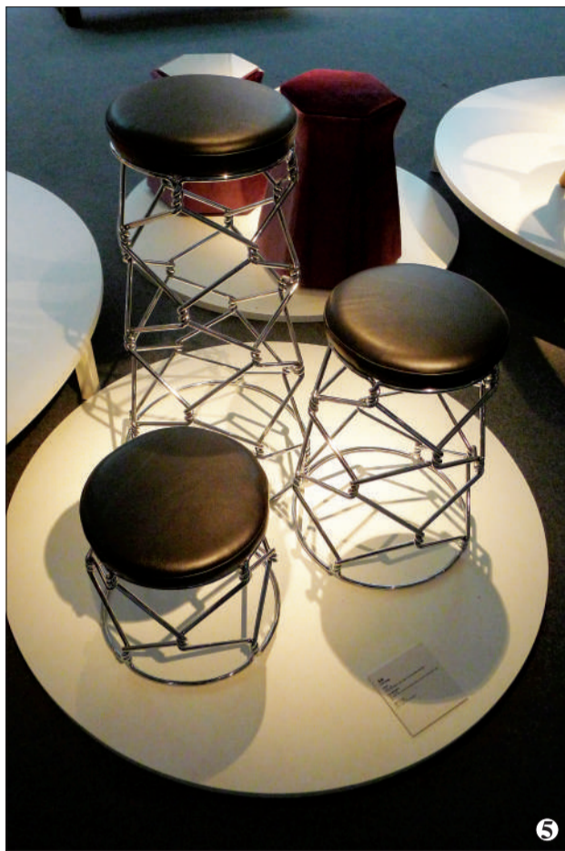
图5：“坐下来”展以椅子为题材，展出了80多件形态各异的椅子。