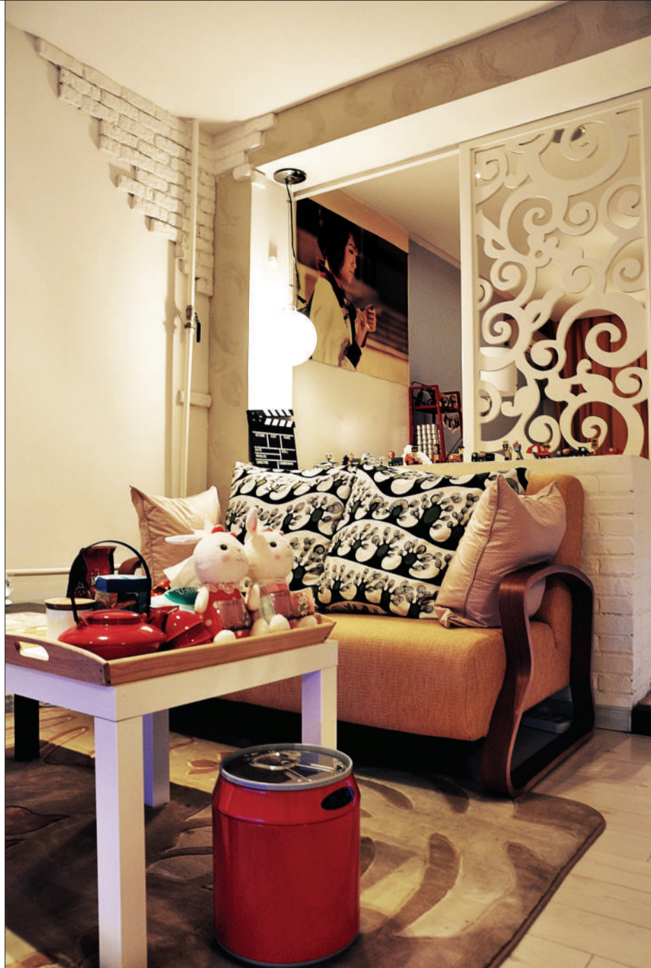
客厅和书房之间那面矮墙拉近了两个空间的距离。