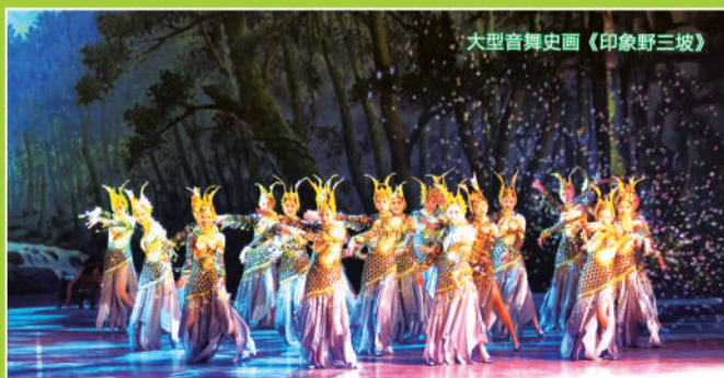
大型音舞史画《印象野三坡》