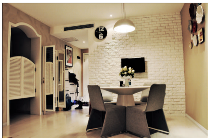
餐厅的白色砖墙也是一种装饰。