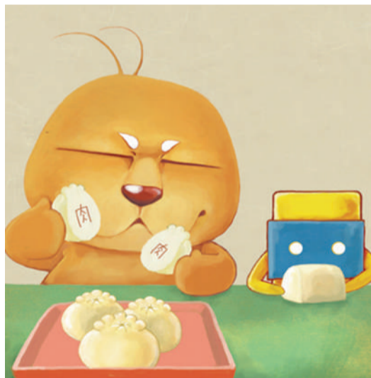
看到了吧,饭堂的包子其实都是馒头的卧底!