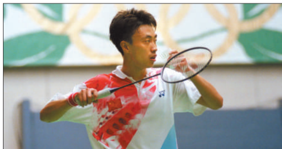
董炯在1996年奥运会上。