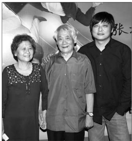
导演张杨和父亲张华勋出席《飞越老人院》首映,两人因为这部电影和解。