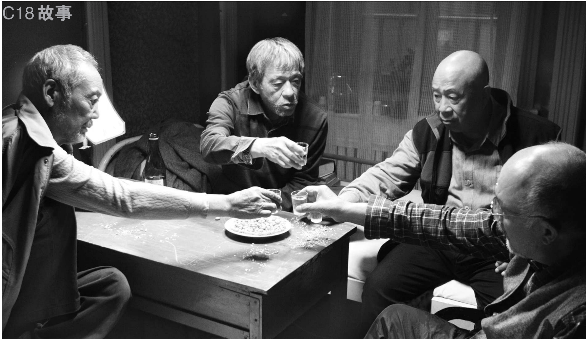
《飞越老人院》中,几位老人在老人院小酌。影片表现的老龄化问题正日益引起社会关注。