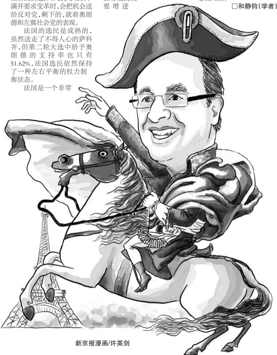
新京报漫画/许英剑