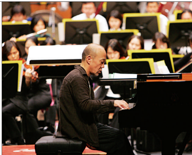
拥有“职人”精神的久石让在商业和艺术之间找到了完美的平衡。