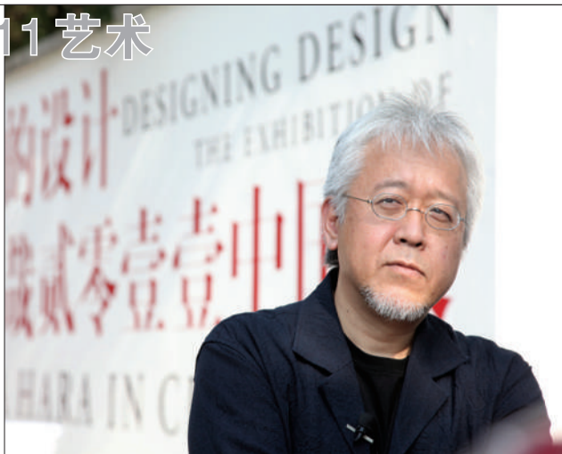
作为当红的设计师,原研哉的书近几年被大量引进。