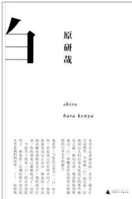
《白》原研哉 著 定价:48.00元 广西师范大学出版社 2012年3月

这不由让我想到一个关于圆的小故事,一个孩子的母亲状告幼儿园的老师限制了孩子的想象力。她的孩子在上幼儿园之前,他会认为一个圆圈是太阳、是车轮、是眼睛……但自从学校的老师教育了他,圆圈是0之后,这个圆圈便与0完全对应了,孩子的头脑中关于圆的所有想象力都被束缚在了0上。原研哉的《白》或许也具有同样的“魔力”。当我们心中的“白”被放大、被束缚、被扭曲,成为一个虚无缥缈的哲学概念,只拥有纸这一种物化形式,只留下“空”的意义的时候,不妨抬头看看头顶的太阳,它或许会让你“明白”更多。