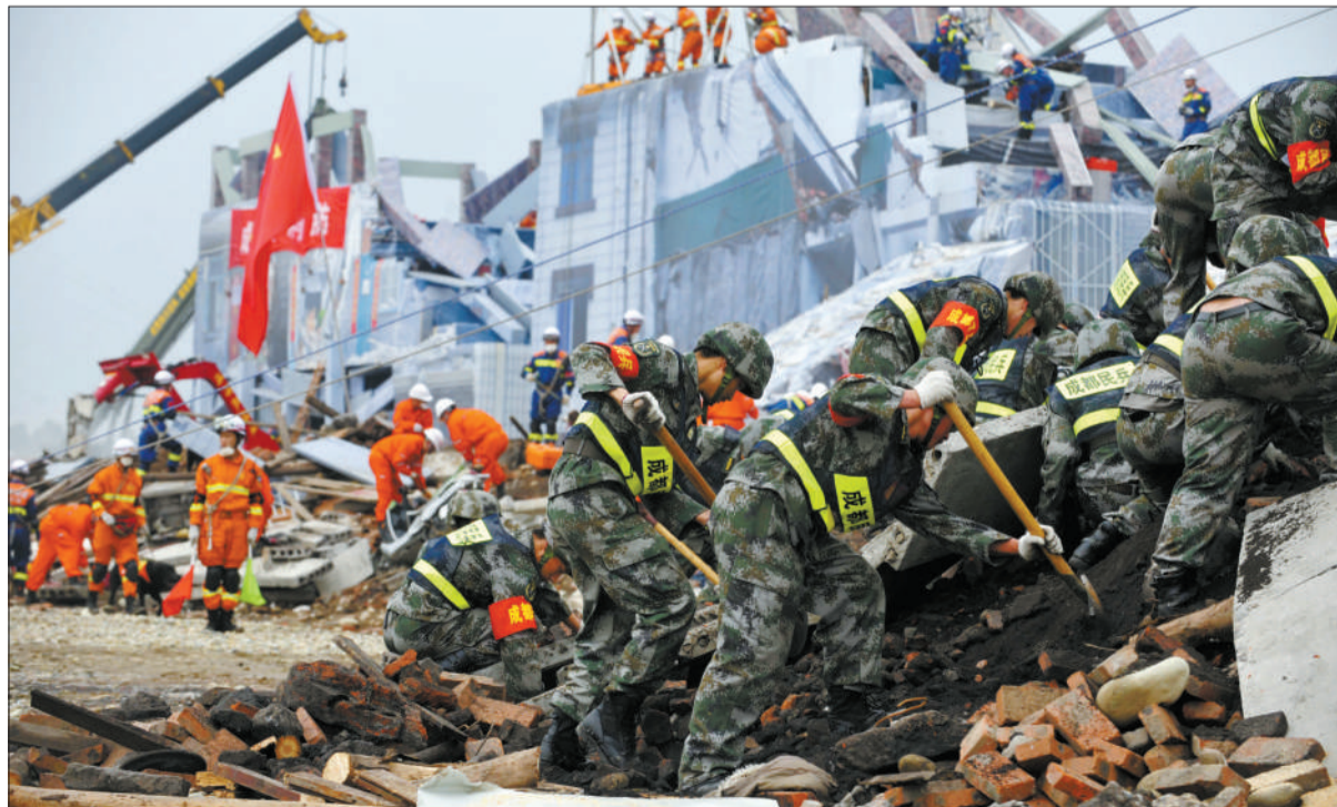
11日,四川开展大型防灾减灾综合实战演练。医护车辆、民兵等在“灾区”展开救援。

回良玉强调,防灾减灾工作要重点抓好以下几个方面:强化组织领导和协调配合,全面落实以行政首长负责制为核心的各项抗灾救灾责任制;强化灾害监测预警,健全完善灾害监测网络;强化防灾减灾基础,进一步加强防灾减灾骨干工程建设,提高城乡建筑物灾害防御性能;着力强化隐患排查治理,及时采取防范措施,严格落实监控管理责任等。