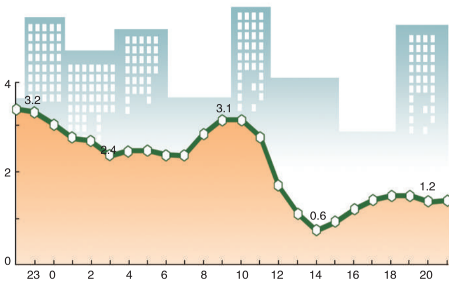
一氧化碳浓度 (单位:毫克/立方米)