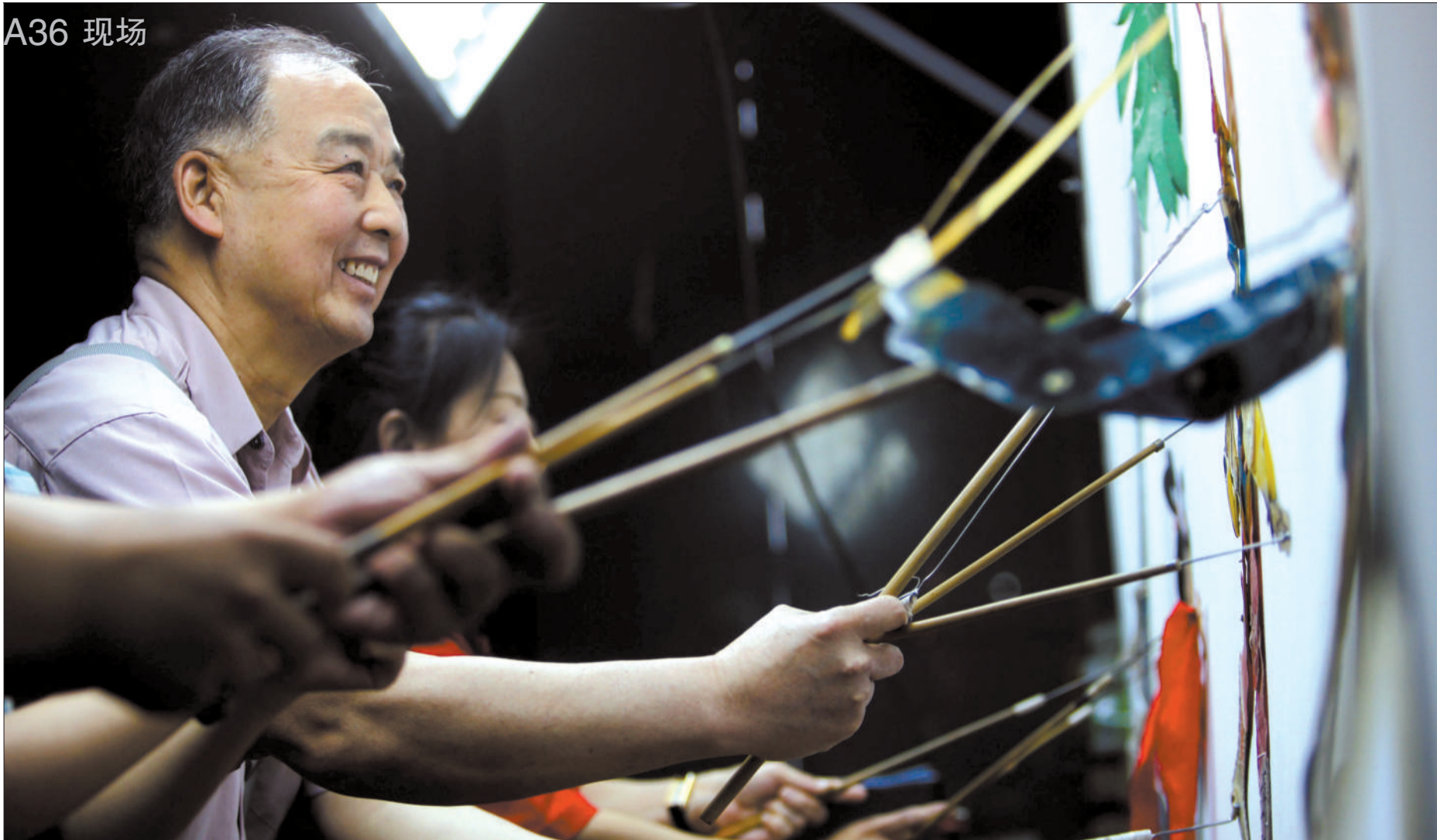
昨日,一名观众在皮影表演艺人的指导下操纵皮影,体验皮影戏的乐趣。当日北京皮影传习所落户天桥演艺区。