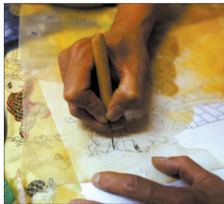
雕刻艺人现场用画针在牛皮上画出唐僧脸谱。