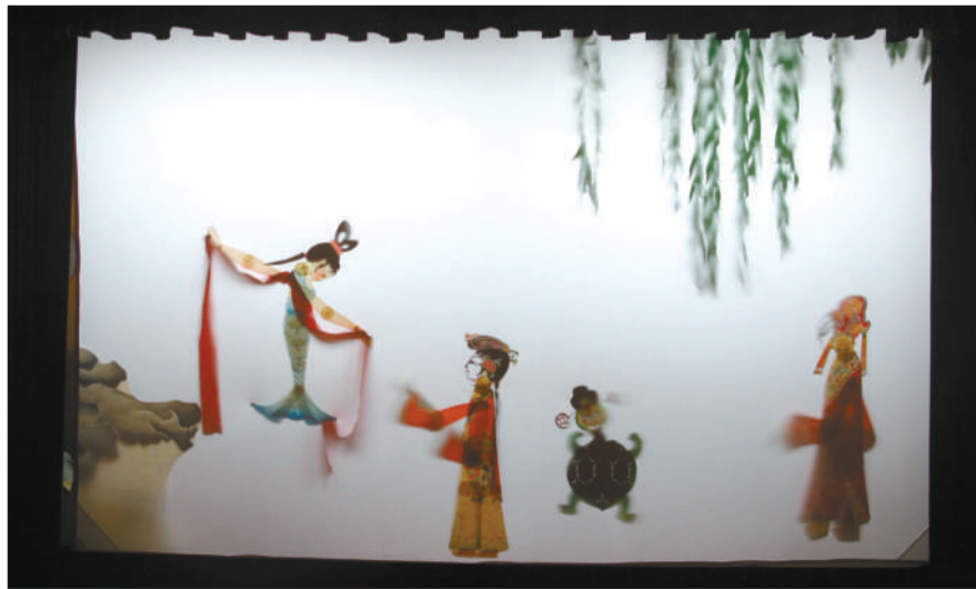
昨日,万胜剧场内,白色幕布上正在上演皮影戏。