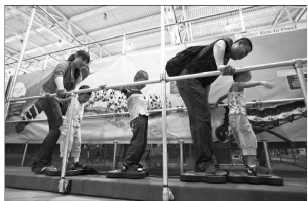
家长和孩子们在“热带雨林冒险屋”里“艰难前行”。

据悉,“非接触式”已逐渐成为科技馆里进行科普的新手段,逐步取代了触摸屏、遥控装置,让普通人在更有趣的技术指导下获得更多的科学知识。