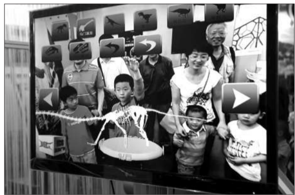
大屏幕前,小朋友和家长们正在“见证恐龙”。