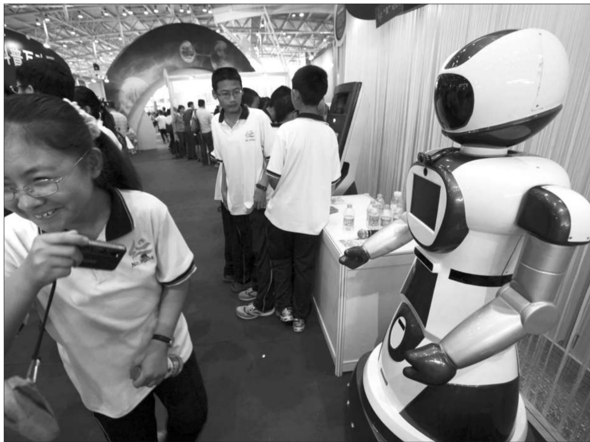
“会认人的机器人”吸引了很多小朋友的目光。经过“走近机器人、人脸扫描、输入你的信息”几道程序,这台机器人便能记住你。