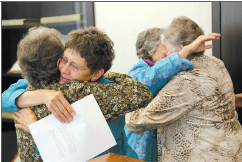
5月10日,美国纽约,同性恋者拥抱庆祝奥巴马明确支持同性婚姻。