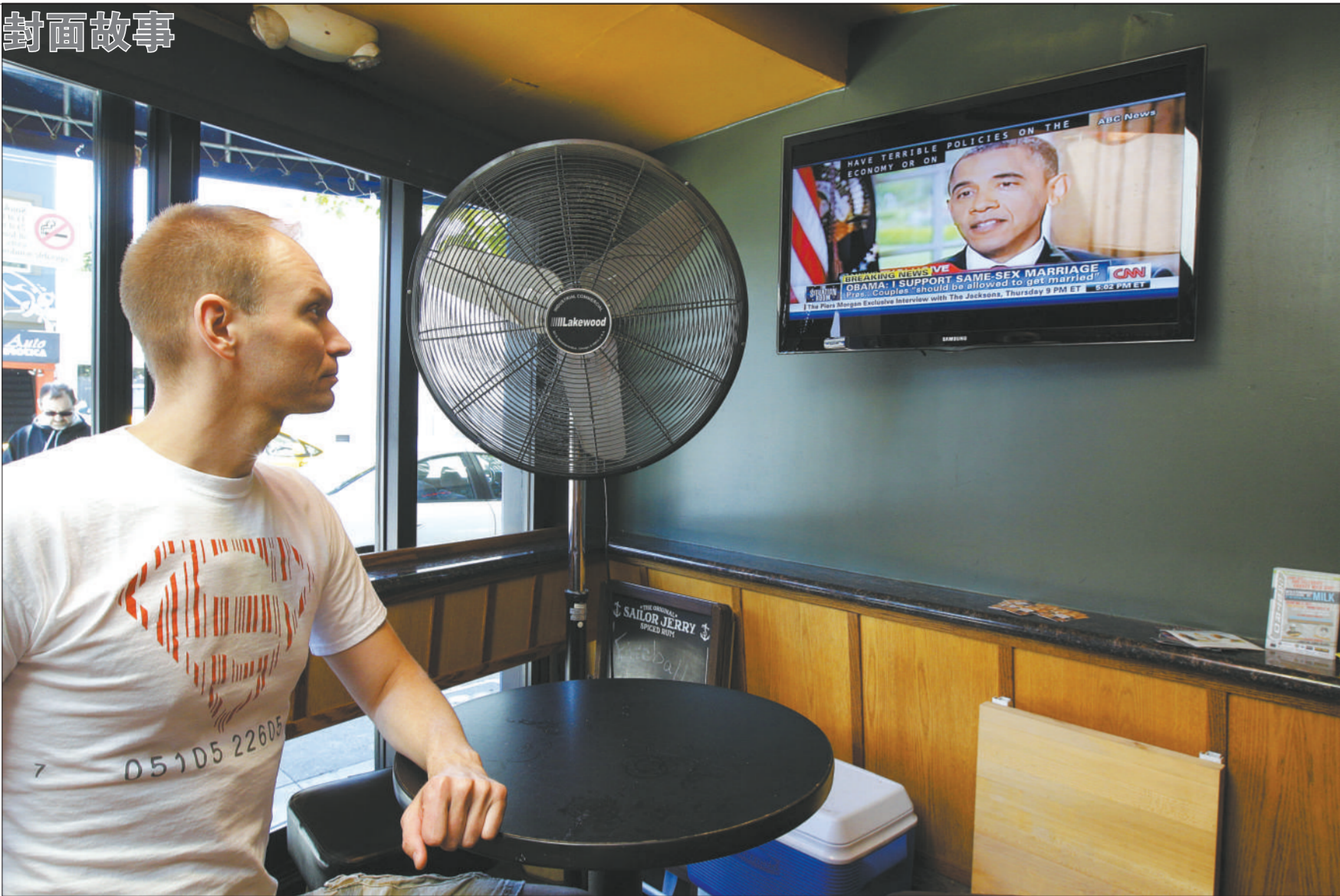
5月9日,美国华盛顿,同性恋者皮尔普斯收看奥巴马接受美国广播公司采访的电视转播。奥巴马表示支持同性婚姻,让同性恋者欢欣鼓舞。