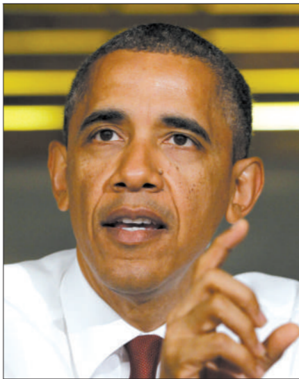
奥巴马力挺同性婚姻。

富豪扎堆的华尔街和明星云集的好莱坞向来是美国政客募捐的两大重镇,奥巴马要与财大气粗的罗姆尼抗衡,必须至少拿下一方。而好莱坞一直是支持同性婚姻合法的重要基地,分析人士称,奥巴马“冒险”表达支持同性婚姻,就是为了向好莱坞示好,赢得后者的支持。