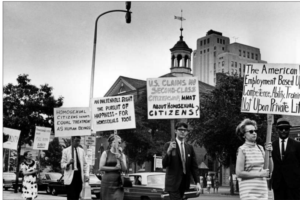
1967年7月4日,美国费城独立厅,示威者参加游行,要求取消对同性恋者的歧视。

但目前美国政治文化逐渐世俗化,美国人对总统的个人要求和道德标准也就随之逐渐下降,但“这种世俗化远没有达到让美国人能够接受一个反复离婚、或者不断爆出丑闻、或者公开支持堕胎政策的总统的程度。”(冯中豪)