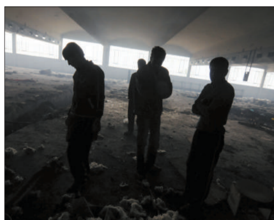
2月29日，几名难民在底比斯一座废弃的工厂内。他们无法找到工作，生活变得更加没有希望。