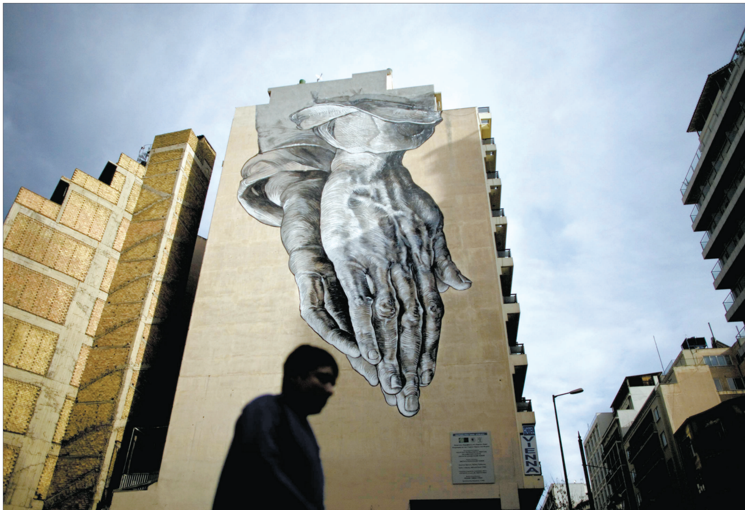
2011年12月6日，一名男子走过画着涂鸦的建筑。希腊雅典街头随处可见反政府涂鸦作品，这些涂鸦反映着民众对于政府财政紧缩政策的困扰和不满。

这就是希腊的现状。所有人都在不停地谈论经济，谈论法国、德国和欧盟，谈论长期以来统治着希腊的精英阶层，谈论邻居和自己所面临的窘境——众人仿佛正在经历一场充满视觉暴力的黑色幽默。（北雪）