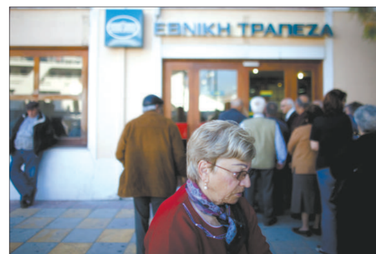
2010年5月4日，一些老年人在希腊米蒂利尼一家银行门前等候开门。