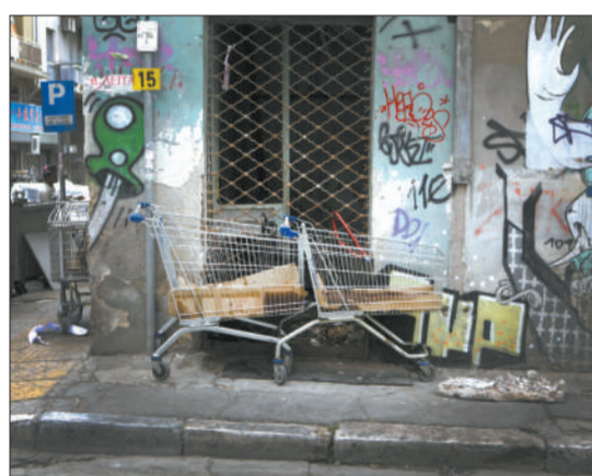
2012年5月9日，雅典街头布满了各种涂鸦，路边随处可见市民捡拾的金属与报纸废品。