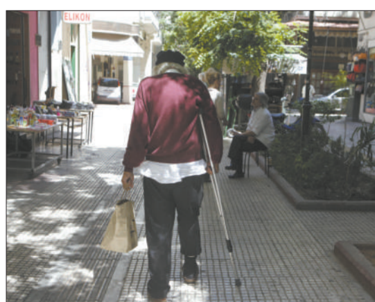
2012年5月9日，一位老人在雅典街头走过。随着经济进一步紧缩，很多雅典市民的生活越发窘迫。