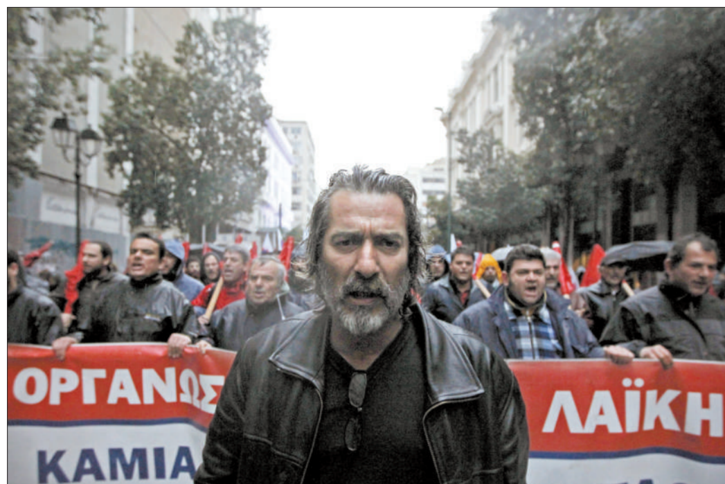
2012年2月22日，希腊雅典，希腊工会成员组织抗议活动抗议财政紧缩政策。随着紧缩政策的实施，各种抗议活动不断在希腊各地发生。