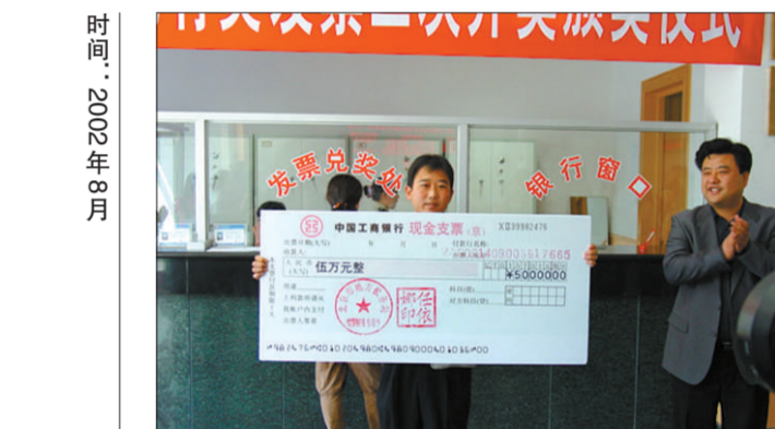
有奖发票特等奖首次亮相密云。