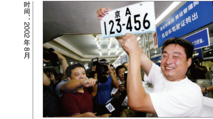
北京办理的第一个2002式车牌“京A123-456”。

“由于消费者不索要发票,我们无法掌握他们的实际运营情况,也难以堵住税收漏洞。”北京市地方税务局副局长杨志强当时说,“现在拿发票可以中奖了,消费者的积极性高了,我们的工作就好开展了。”