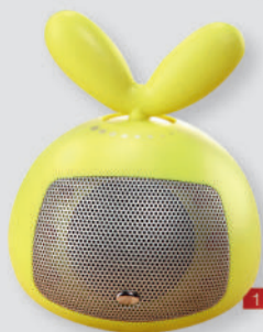
抽象月牙兔音箱 市场价268元