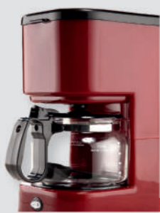
5杯美式滴漏式咖啡机SCM0001 市场价299元