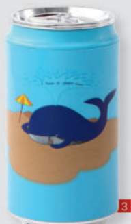
USB可乐罐加湿器 市场价248元