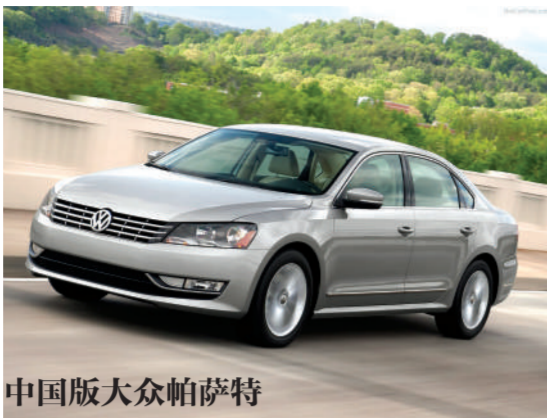
中国版大众帕萨特

相比中国版凯美瑞,美版显得更加运动,内外设计风格也都与中国版本的平庸有一定区别。整车提供3年/3.6万英里的保修,动力总成保修期为5年/6万公里。 排量:2.5L、3.5L V6 售价:折合人民币 13.88万-18.87万元