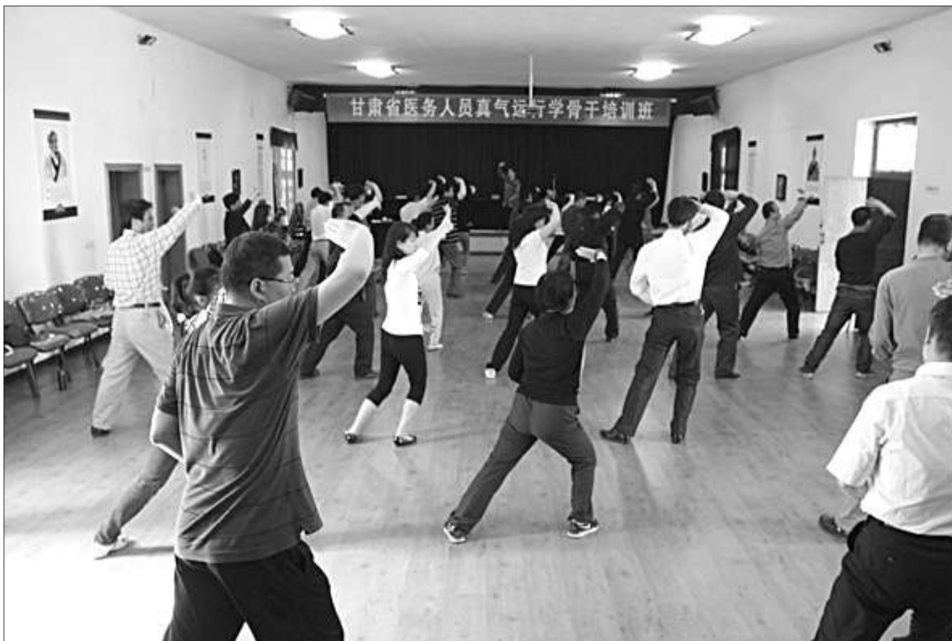
甘肃省医务人员真气运行学骨干培训班学员正在练习,他们是来自各地医院的领导和医务人员。