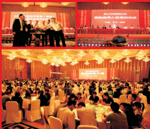
2012年5月22日成都招商大会现场