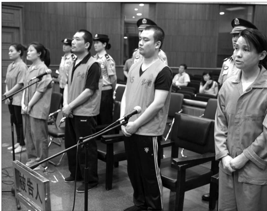
庭审现场。昨日,去年警方侦破的最大“假洋文凭诈骗案”在法院开庭,一被告人否认诈骗指控。