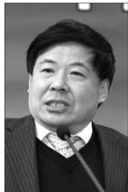
财政部副部长朱光耀