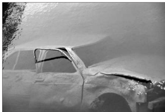
让·鲍德里亚1987年的作品《圣克莱门特》。