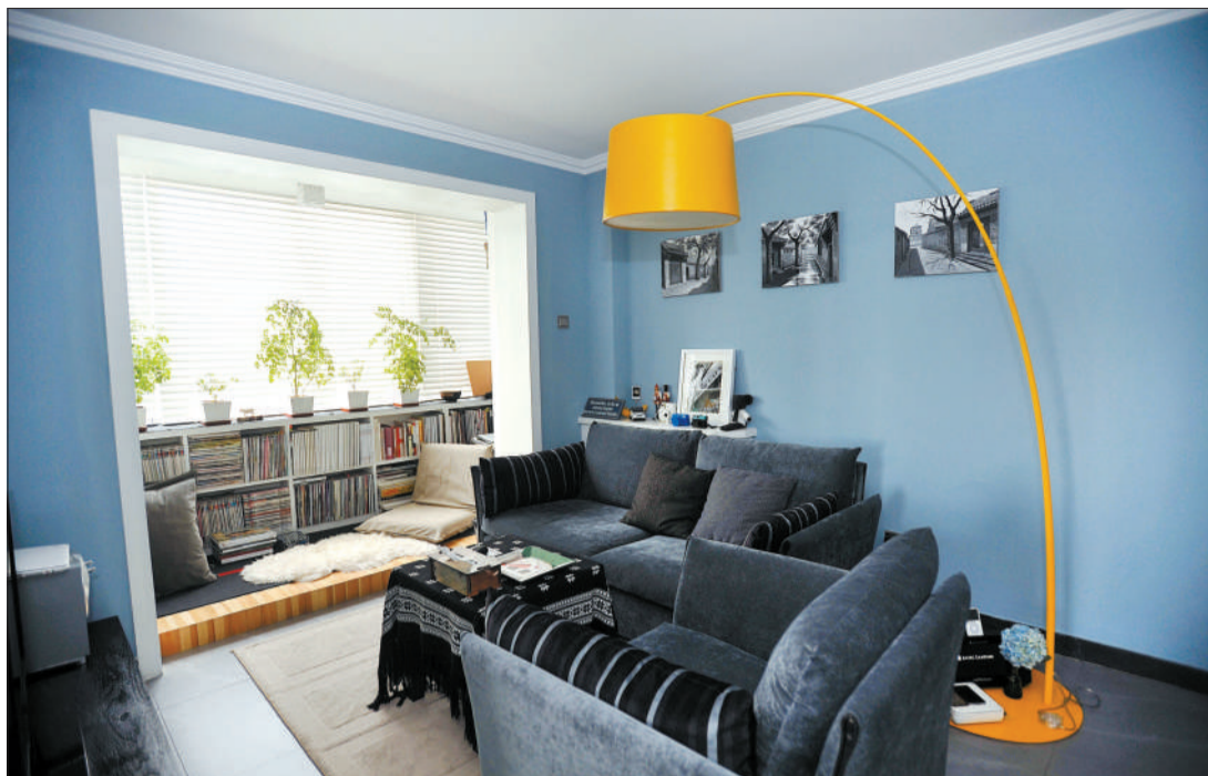
在保证自然采光的同时,选择节能灯泡和光源多分支设计可以起到省电的效果。