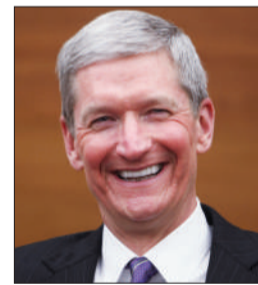
苹果首席执行官库克。

据外媒近日报道，美国苹果公司在一份递交给美国证券交易委员会的文件中说，公司首席执行官库克所持超过100万的限制型股权不会参与分红，即自愿放弃7500万美元分红。文件没有提及库克放弃分红的原因。