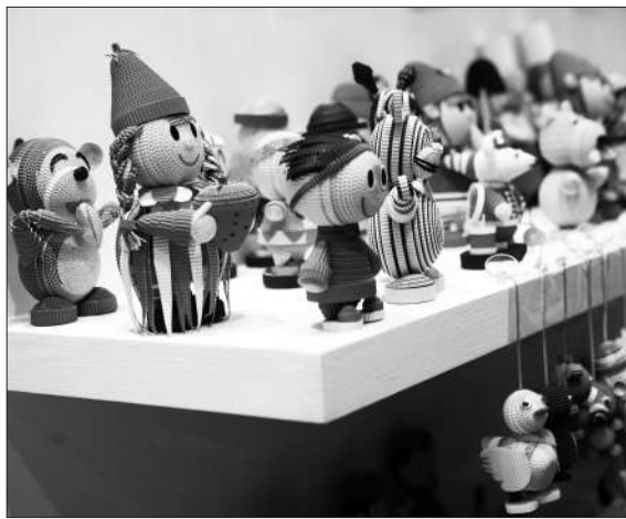
昨日,京交会台湾展位,参会者观看用纸制的玩具。新京报记者 秦斌 摄