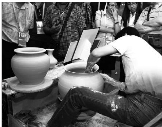
昨日,景德镇陶瓷展的参展商现场制作陶瓷吸引了大量观众驻足观看。