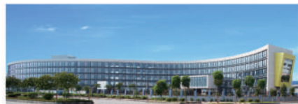
北京江河幕墙股份有限公司

顺义区企业上市的发展历程也是区域经济腾飞和金融崛起的历程。产业为本,金融为用,产融结合,产融一体化是顺义经济发展的路径。产业精英与金融精英选择顺义,必将造就顺义区企业上市和金融产业的再度崛起!