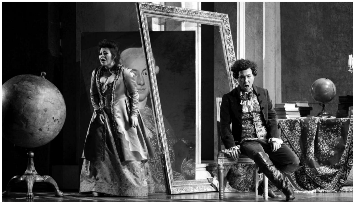
国际大导乌戈用诗情画意的手法讲述歌剧《假面舞会》中的阴谋与爱情。

新京报讯 (记者天蓝) 从威尔第的《茶花女》到瓦格纳的《托斯卡》,大剧院这些年制作的经典歌剧都在以视觉大片的手法、国际水准的制作吸引观众走近歌剧。而周日结束的最新作品——威尔第的晚期经典《假面舞会》也是此类大手笔的又一次成功尝试。本报观剧活动上周邀请读者对其点评,20人为该剧打出了95分,打破了此前歌剧《漂泊的荷兰人》以及《托斯卡》保持的最高观剧得分。