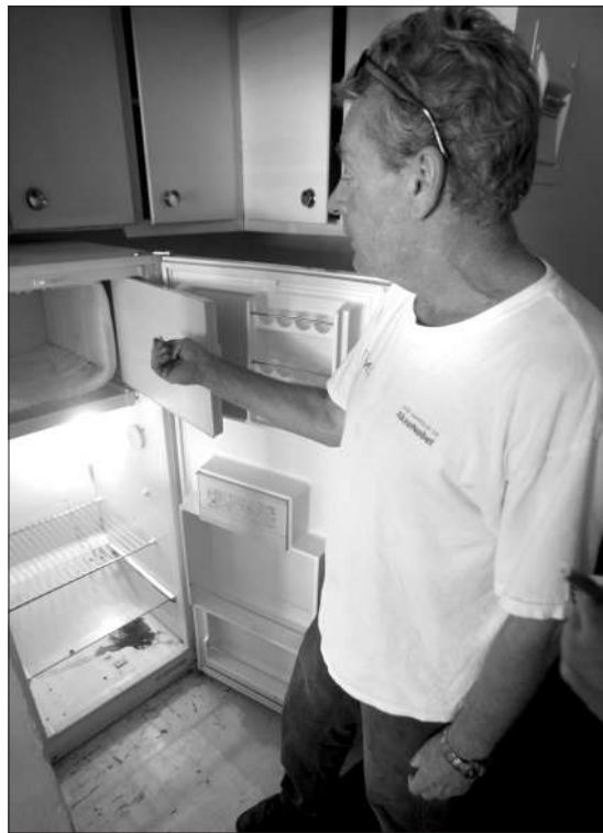
5月30日,加拿大蒙特利尔,疑犯曾居住的楼房的工作人员察看血迹斑斑的冰箱。