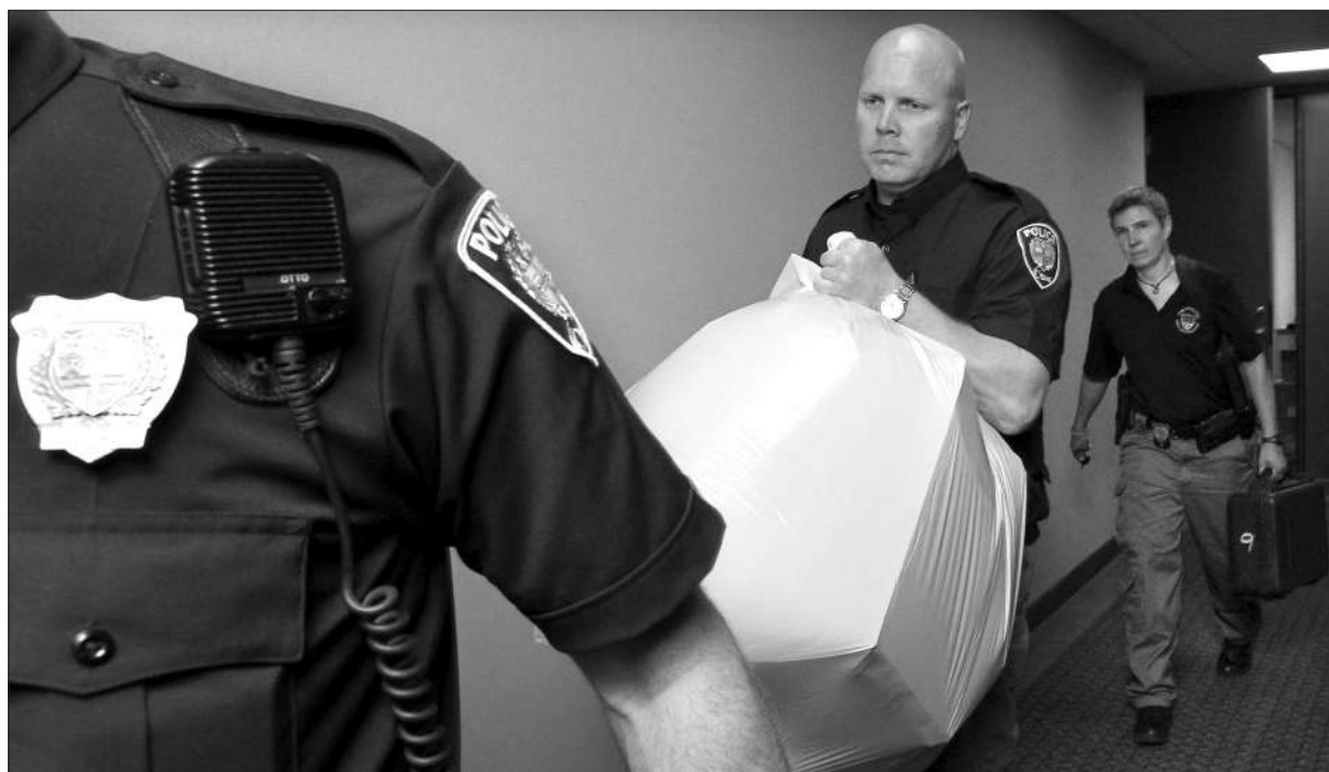
5月29日,加拿大蒙特利尔警方在一栋楼房中发现一个藏尸的箱子。