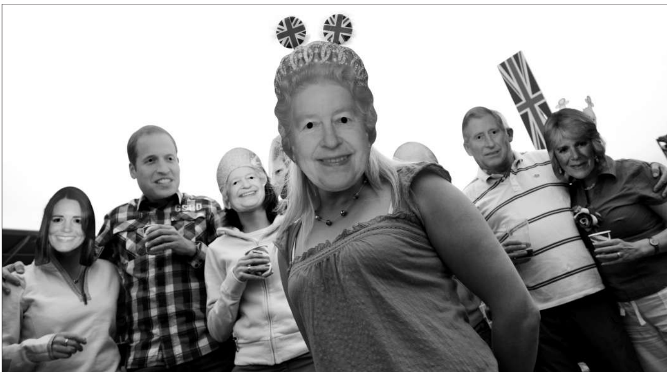
2日,英国埃普森德比赛马活动第二日比赛。图为观众戴着王室成员的面具,等待比赛的开始。埃普森德比赛马活动是庆祝英国女王登基60周年的首个官方活动。

虽然政府需挪用纳税人的钱财来供养王室,但不能忽视英国王室作为一种文化传统和象征意义给英国所带来的影响力,这也不是用金钱能衡量的。(宋雄伟(学者))