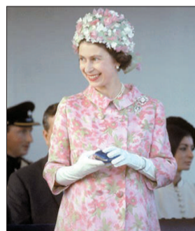
上世纪60年代末的女王。