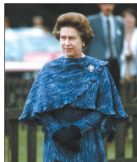
上世纪80年代的女王。