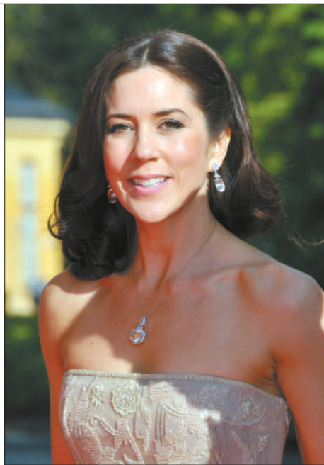
丹麦王储妃玛丽·唐纳森 嫁入王室前在澳大利亚一家国际广告公司担任体育方面的工作。