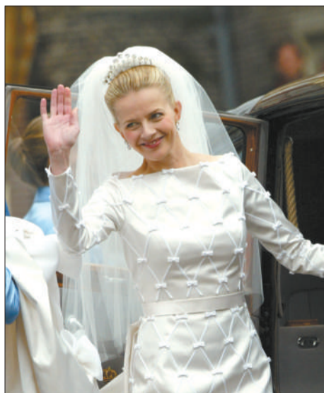
荷兰王妃斯密特 荷兰王储为了与她结婚,放弃王位继承权。