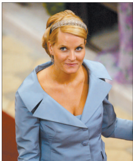
挪威王妃梅特·玛丽特 遇到挪威王储哈康之前,她是夜总会的女侍应,并有一个私生子。