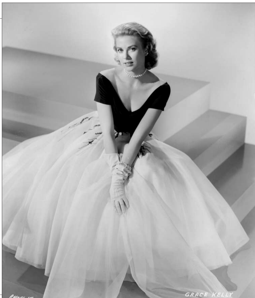
摩纳哥王妃格蕾丝·凯莉 嫁入王室前,她是好莱坞著名影星,曾获奥斯卡奖。