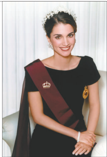
约旦王后拉妮亚 她是难民的女儿,嫁入王室前在银行工作。