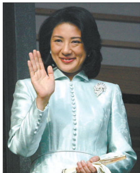
日本太子妃雅子 嫁入王室前,她是外交官。