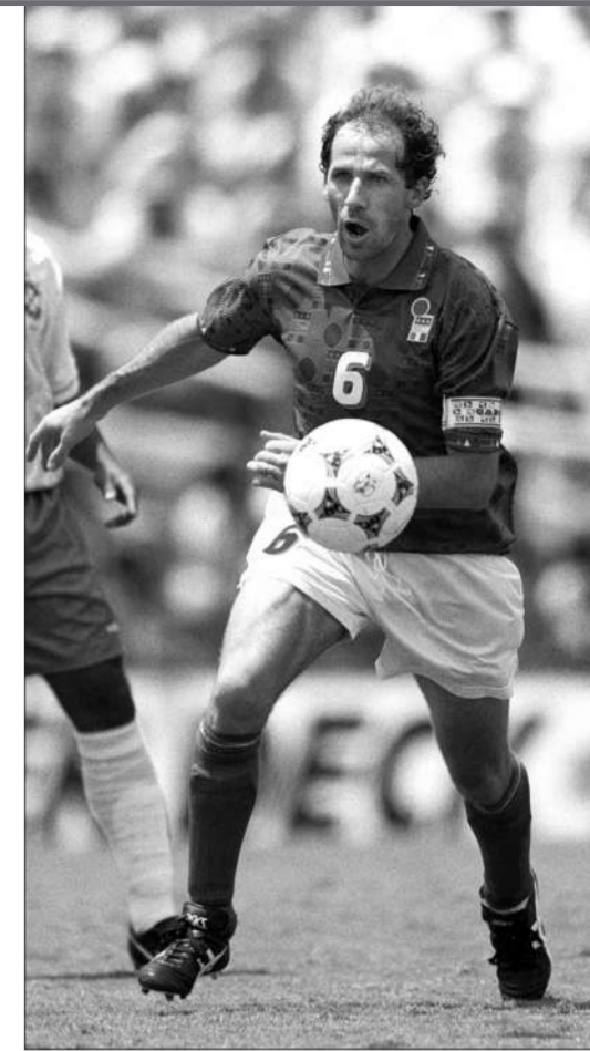
巴西是将防守变成艺术的大师。