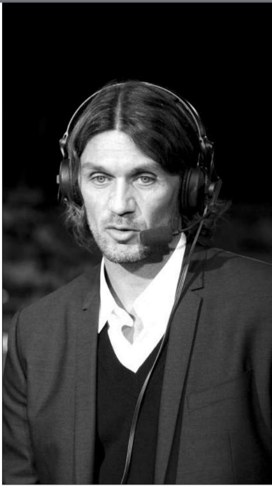
挂靴后,马尔蒂尼以另一身份出现在赛场。