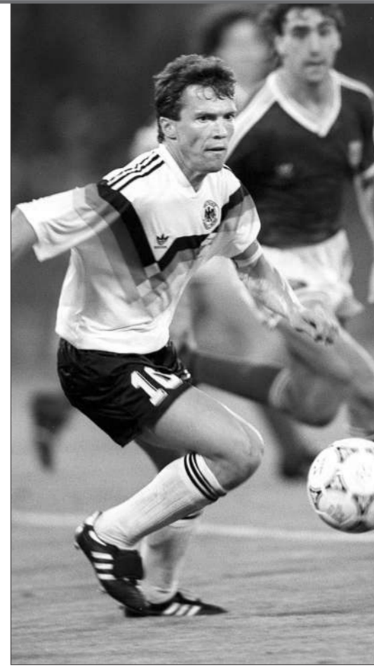
马特乌斯继承了足球皇帝的真传。