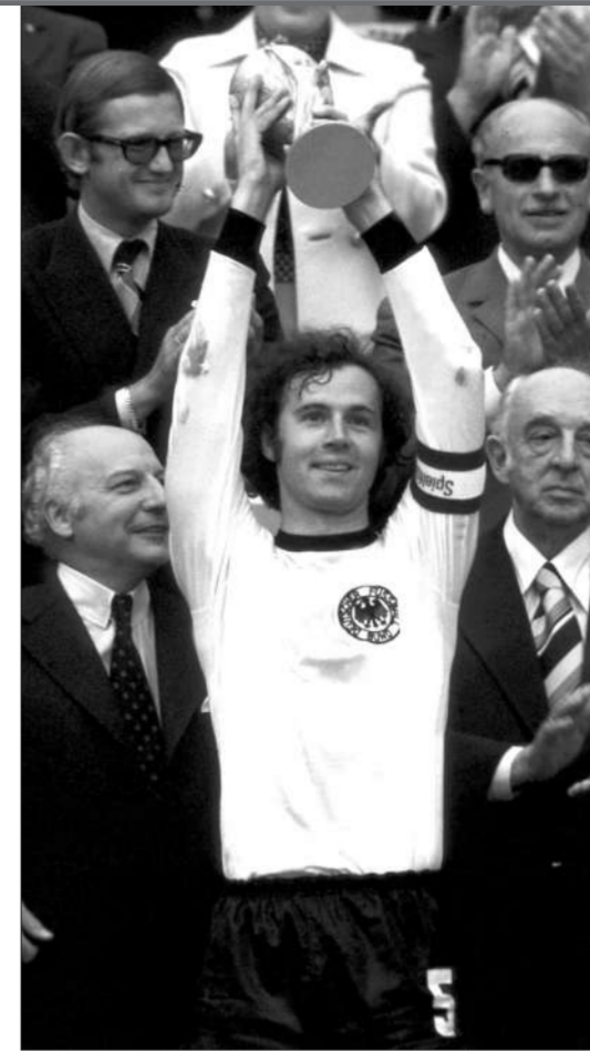
贝肯鲍尔是足球场上清道夫的鼻祖。