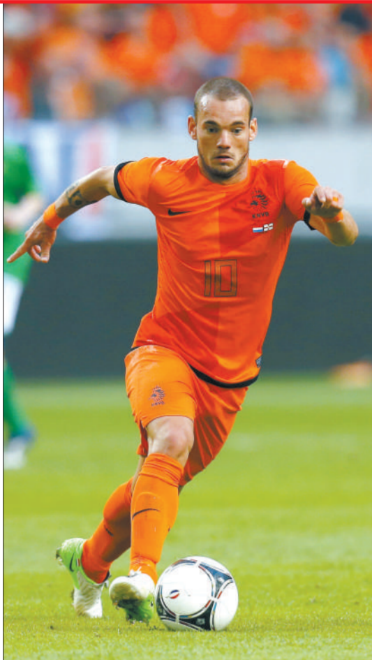
荷兰在世界大赛中总是充满悲情,他们从不缺少如斯内德(左)、范佩西(中)、罗本(右)这样的大牌,但总是缺少冠军运。