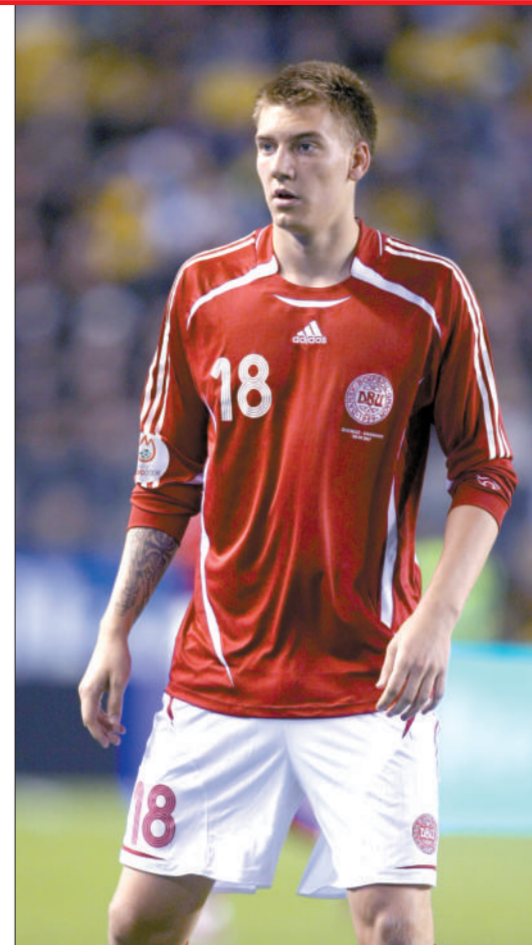
阳光型帅哥本特纳。