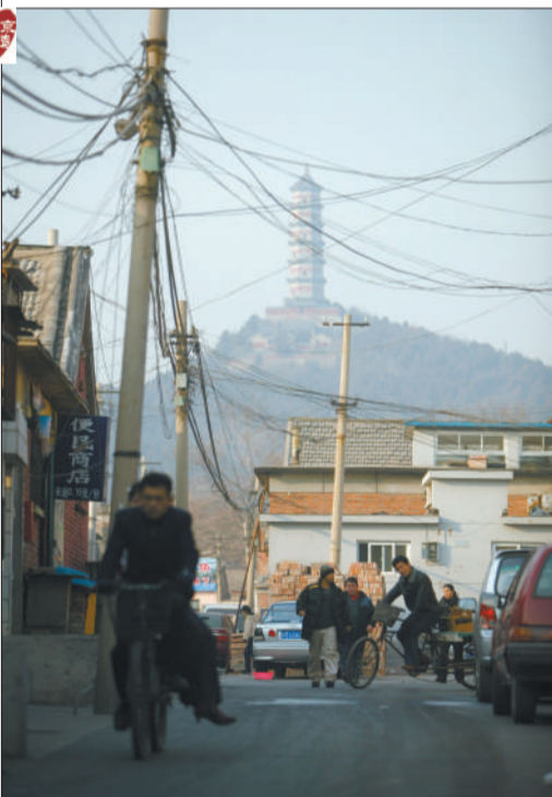
玉泉山下的北坞村旧址。