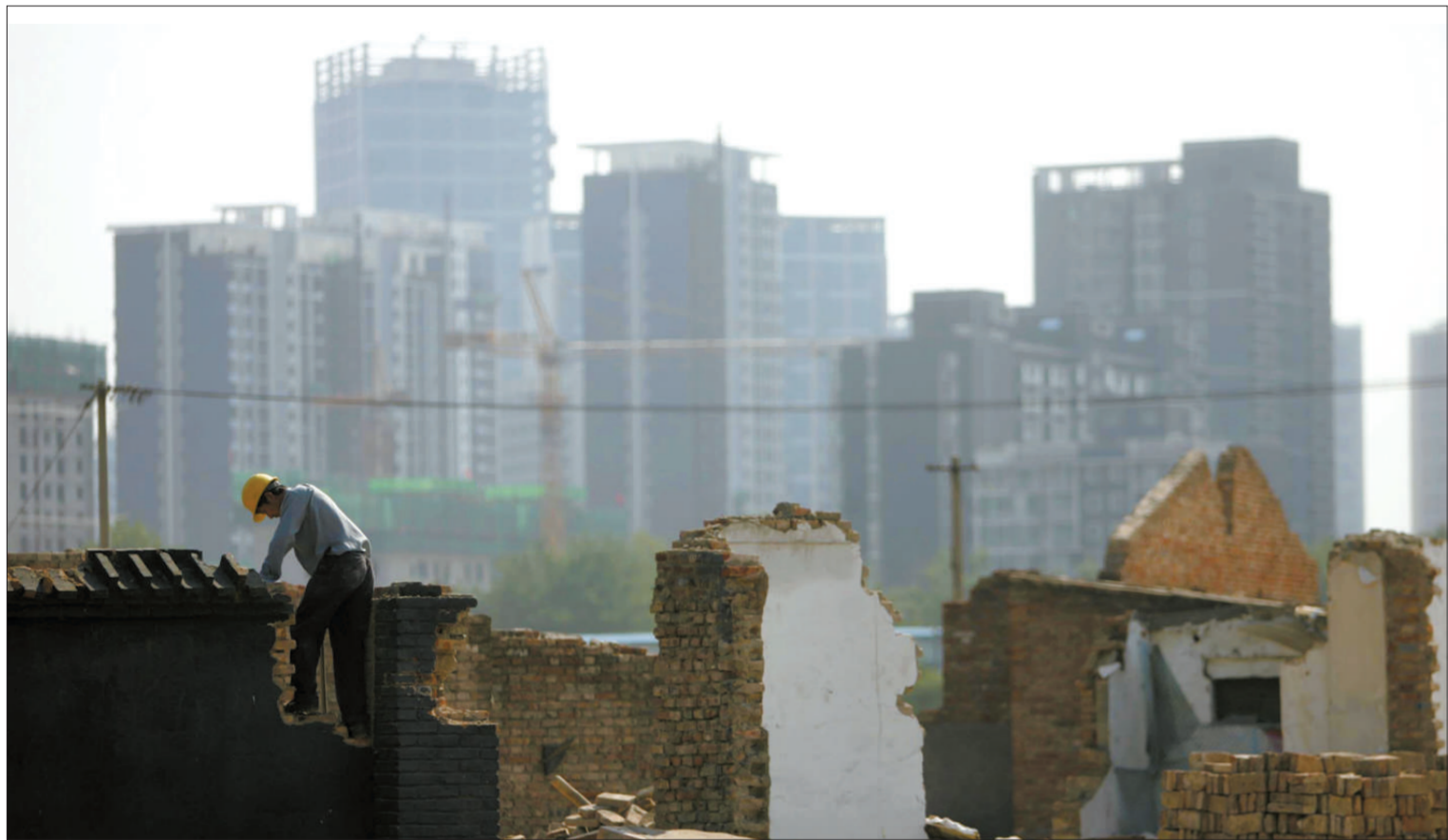
2009年6月11日,大望京村,一名工作人员在拆除旧房屋。大望京村旧村民房腾退全部完成。