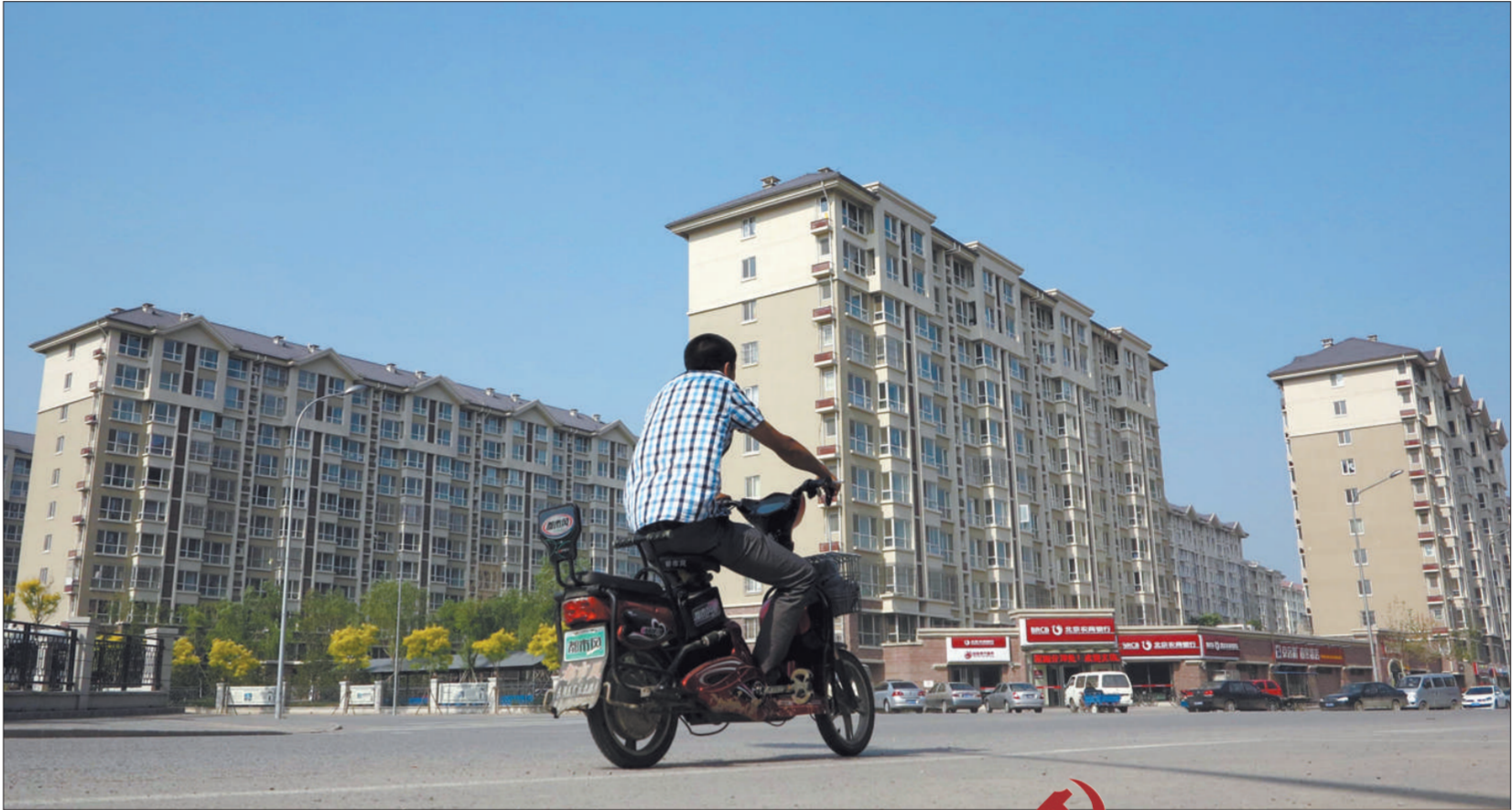
2012年6月5日,大望京居民回迁地京旺家园。