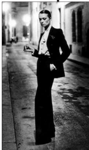
▲ Yves Saint Laurent 经典的 Le Smoking 装。