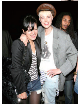
▲ 模特 Agyness Deyn 不仅外形像个男孩,连私下都经常以男装示人。