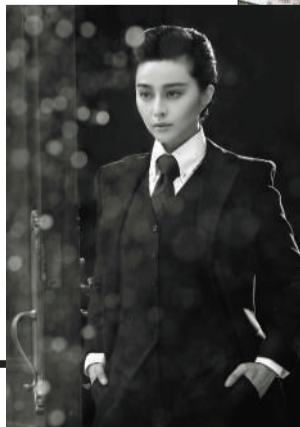
◀ 范冰冰的男装造型。