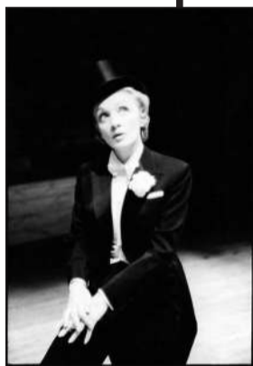
▲ 30年代红星 Marlene Dietrich 凭借电影《摩洛哥》中 中性套装打扮而走红。