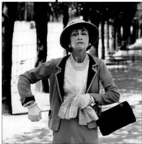
▲ Coco Chanel 的中性风格,至今仍对 时装界有重大影响。