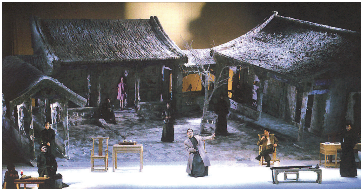
“鬼才导演”李六乙版的《北京人》在舞台视觉上进行了大胆创新，最初也因为少了一些“人艺味儿”而受到争议。

与观众熟知的“人艺味儿”不一样而引发小范围的争议。 评论家童道明十分肯定李六乙“话剧中国化”的尝试，他甚至提出，这是北京人艺演出史上的“第三座里程碑”（前两部分分别为焦菊隐导演的《茶馆》和刁光覃、林兆华导演的《狗儿爷涅槃》）。新版《北京人》上演之后，票房不错，媒体和评论界也叫好声连连，一扫先前“关门戏”的阴霾，成为迄今为止影响最大，也最为成功的一版《北京人》。