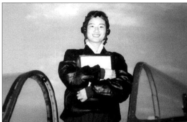
▲刘洋在部队执行飞行任务。