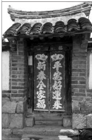
2012年5月26日，王亚平在烟台张各庄村的老家。

王亚平的家在村庄最北侧，紧挨着山坡处，一栋青砖灰瓦搭建的老式农舍。院子的两扇大门上，红色镶金春联仍没有褪色，散发着喜庆的光彩。门框上，贴着一张黄色的标牌，标牌显得有些陈旧，但上面的字