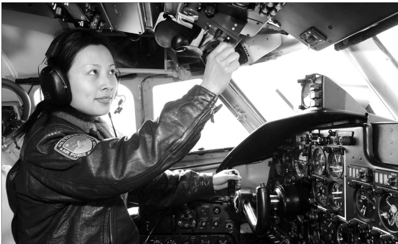
2009年2月11日，空军女飞行员王亚平在山东潍坊投入抗旱工作。

作为我国第七批女飞行员的一员，王亚平曾驾机参加过多次战备演习、汶川地震抗震救灾、北京奥运会消云减雨等重大任务。